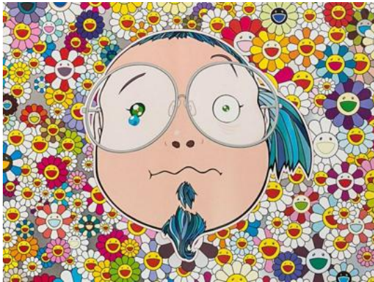
Autoritratto di Murakami Takashi, intitolato 'Murakami-kun, quel surprise et quel dommage'